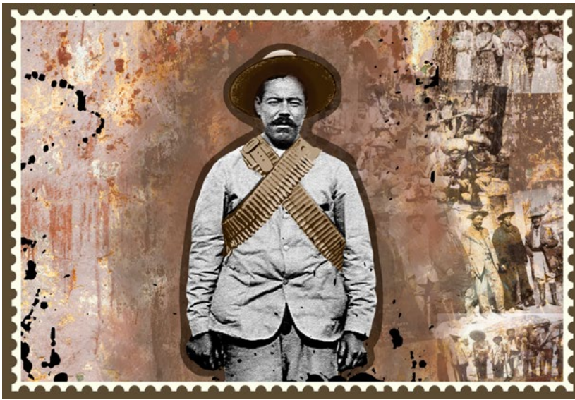
Montaje: Valeria Flores

Como todo proceso histórico , la Revolución mexicana trajo cambios que no sólo permearon las esferas políticas y económicas, sino que también abrieron un cauce en los diversos terrenos sociales; en el arte, por ejemplo, surgieron nuevos temas, innovadoras formas de ver la realidad y de afrontar la transición política del país.