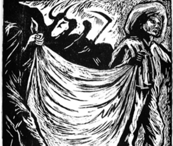
Campesinos manifestando Arturo García Bustos Xilografía 65 x 57 cm

La exposición se encuentra en la Galería “Fernando Cano”, Edificio Histórico de Rectoría, y estará vigente hasta el 15 de agosto del 2021. La entrada es libre todos los días (martes a viernes de 9 a 19 horas; sábados y domingos de 10 a 17 horas) y se puede agendar un recorrido personalizado a través del correo pcu.visitasguiadas@gmail.com . 📍