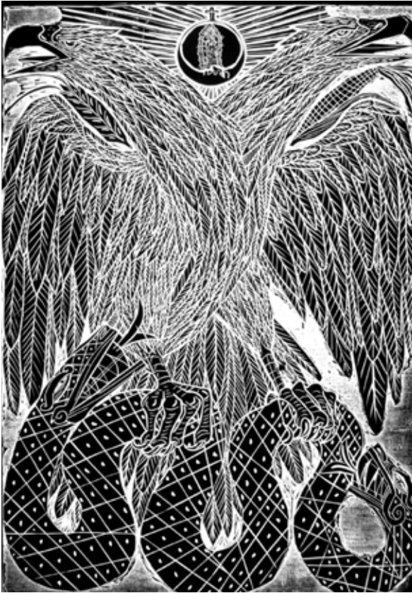
Bicéfala, bípida y bicentenario Joel Rendón Linóleo 95.8 x 67 cm