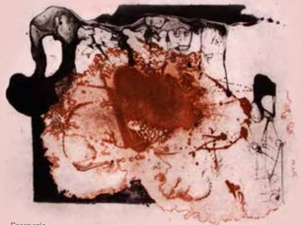
Escenario Manuel Felguérez Heliograbado 50 x 40 cm

LA SELECCIÓN DE OBRA ES AMPLIA EN CUANTO A TÉCNICAS, FORMATOS Y GENERACIONES, ADEMÁS DE QUE SE TRABAJÓ CON LOS PRINCIPALES TALLERES DE IMPRESIÓN EN EL PAÍS