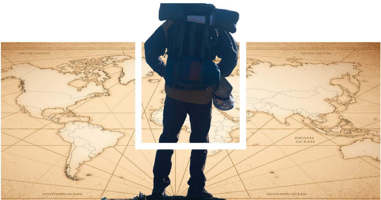
Ilustraciones: Gerardo Mercado

QUIEN DESEA DESCUBRIR EL CONTEXTO DE LAS MIGRACIONES NECESITA SUMERGIRSE EN LOS CUERPOS VIAJEROS, ESTIGMATIZADOS, DESPRECIADOS